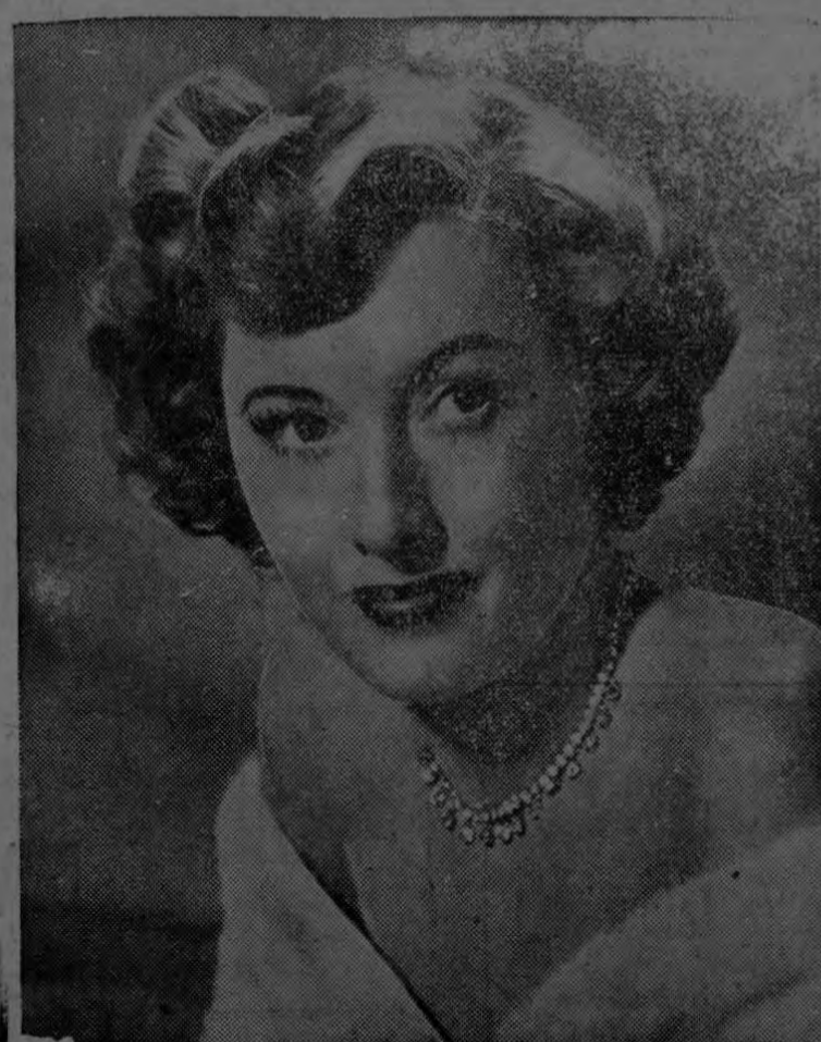
BARBARA STANWYCK - Estrella de la Metro Goldwyn Mayer

Bárbara Stanwyck es una mujer íntegra y sincera, además de ser una consumada actriz. Los aficio- nados al cine saben que invariable- mente pueden esperar buenas representaciones de la Stanwyck. En su brillante carrera cinematográ- fica ha recorrido toda la gama de las caracterizaciones, desde la tragedia hasta la comedia lige- ra.